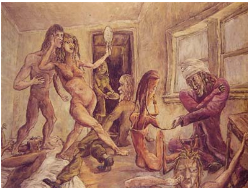
ISSER ARONOVICI „Love-In“, 1967. Öl auf Leinwand, 125 x 165 cm