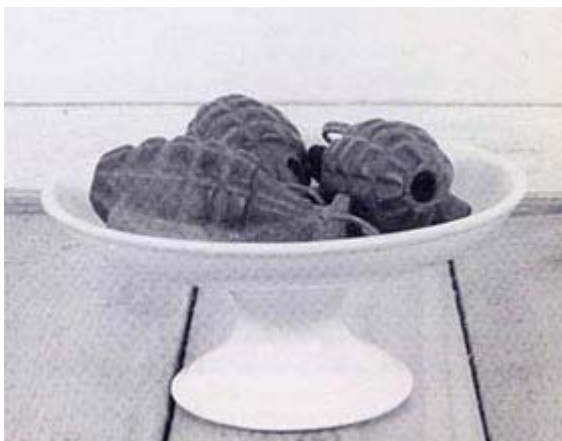
SAM GOODMAN "Three Grenades", 1961.