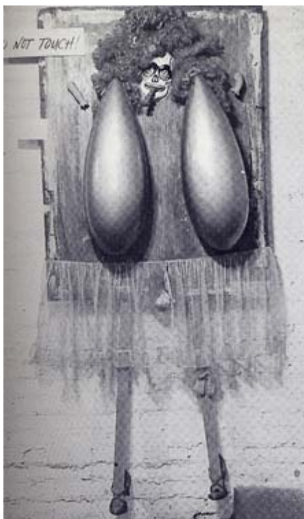
SAM GOODMAN "Female Fetish", 1961.